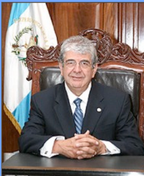
DR. RAFAEL ESPADA VICEPRESIDENTE DE LA REPÚBLICA DE GUATEMALA

EL SITIO "GUATEMALA TRANSPARENTE" ESTÁ PUESTO A SU DISPOSICIÓN POR LA VICEPRESIDENCIA DE LA REPÚBLICA DE GUATEMALA, CON EL APOYO DE LA CONFERENCIA DE NACIONES UNIDAS PARA EL COMERCIO Y DESARROLLO -UNCTAD-.